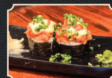
Nigiri thon rouge

37. Nigiri avocat / nigiri tamago (omelette japonaise) 22